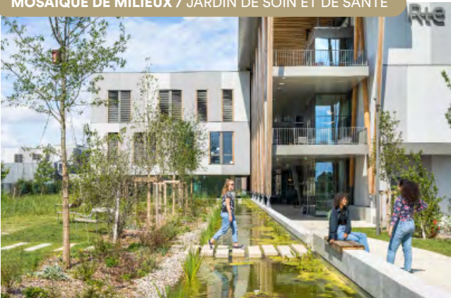
Campus Transfo RTE, Jonage. © AIA Life Designers, architectes - photo : Sergio Grazia.