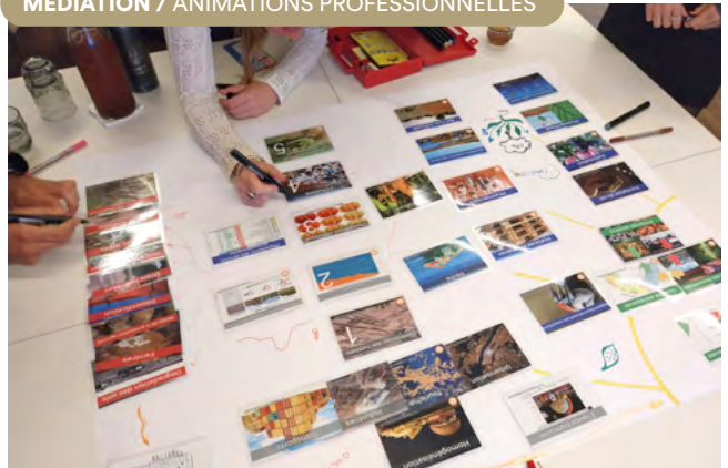
Atelier de la Fresque de la Biodiversité, Paris.