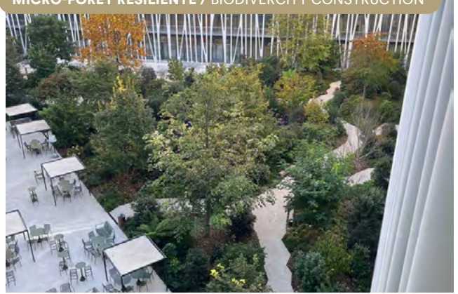
Immeuble de bureaux, Île-de-France (confidentiel). Labellisé "Conception et Consolidation" - © AIA Life Designers.